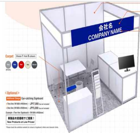
<전시 부스 구성>